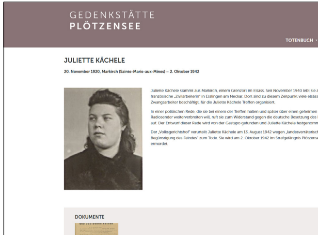
Digitales Totenbuch der Gedenkstätte Plötzensee, 2024