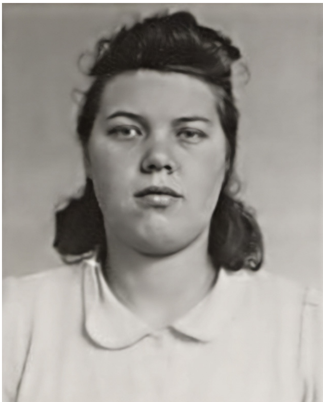
Erkennungsdienstliches Foto der Gestapo nach der Festnahme, 1941