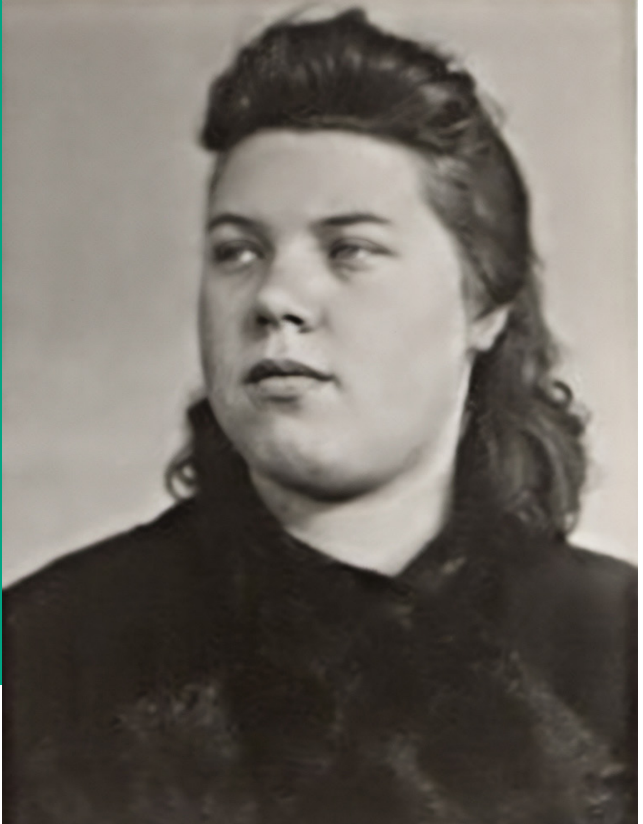
Erkennungsdienstliches Foto der Gestapo, 1941